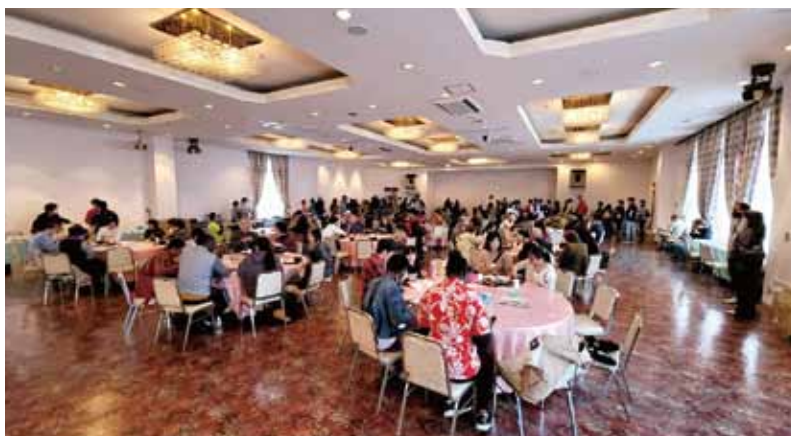
WORLD FESTIVAL Oct 28, 2023 at Kappo Ishiyama